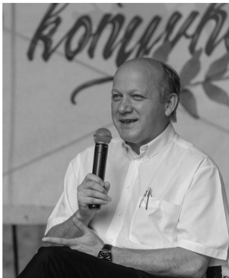
A szerző: Visky S. Béla

A református egyház túlságosan lelkésközpontú – állapítja meg egy pon-