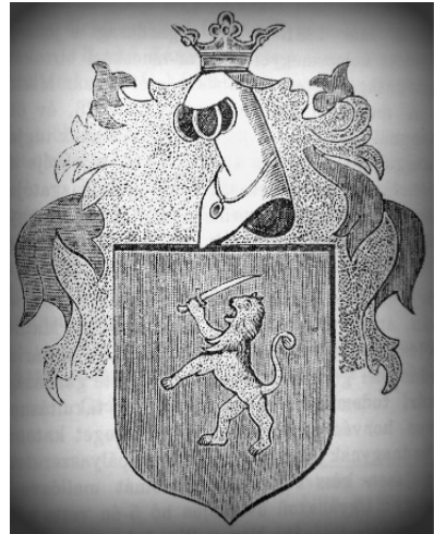
A laborfalvi Berde család címere