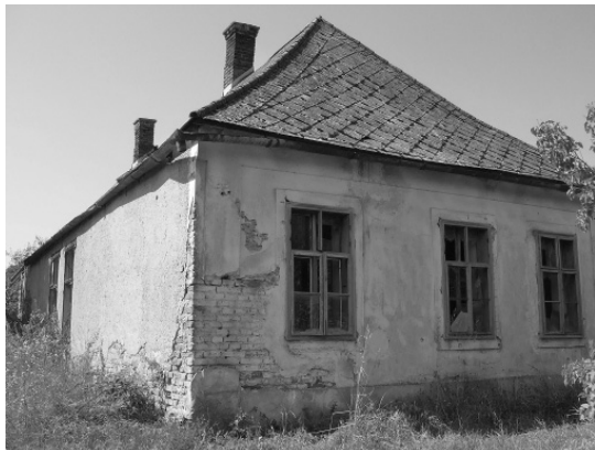
A kackói omladozó református parókia (2017-ben készült felvétel)