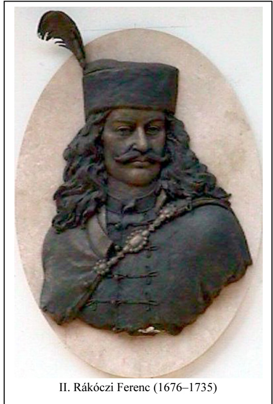
II. Rákóczi Ferenc (1676–1735)

Mutass, Jézus, kies földet, Lakásomul adj jó helyet, Ez életben csöndességet, Jövendőben üdvösséget!